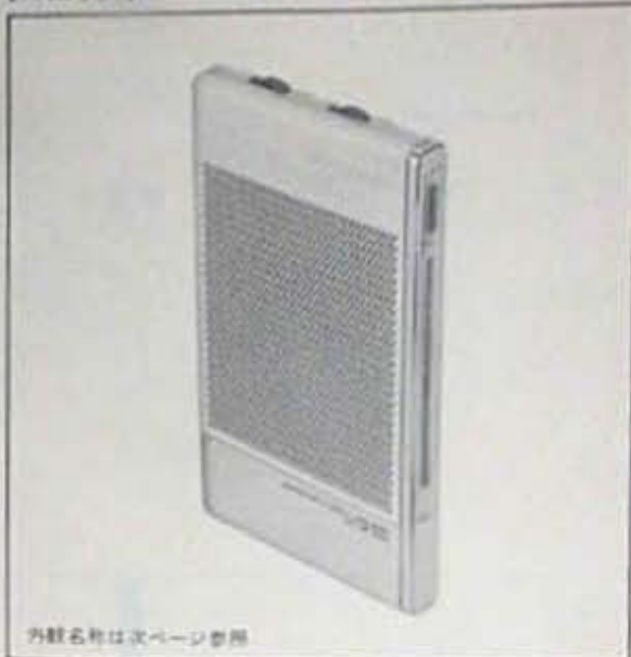
外觀写真は次ページ参照